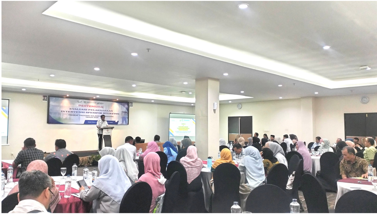
emerintah Provinsi Sulawesi Tenggara (Sultra) menargetkan penurunan signifikan angka stunting dari posisi saat ini sebesar 26,1 persen