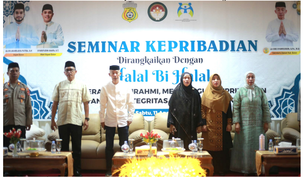
Pemerintah Kabupaten Buton bersama Dharma Wanita Persatuan (DWP) Kabupaten Buton menegaskan pentingnya pembangunan sumber daya manusia