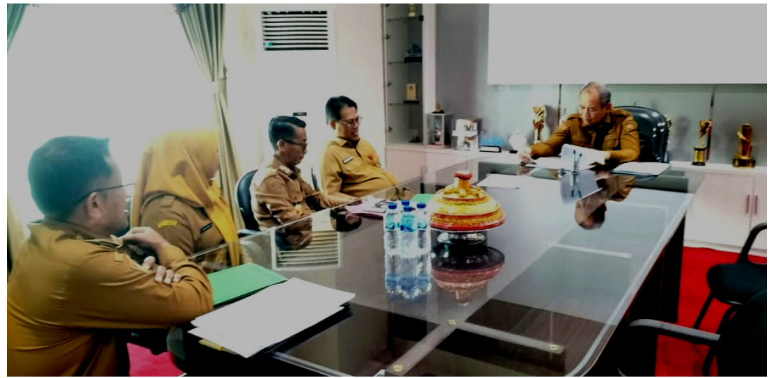
Pemerintah Kota Baubau menargetkan capaian prestasi hingga tingkat nasional setelah merampungkan seleksi Pasukan Pengibar Bendera Pusaka (Paskibraka) tahun 2026