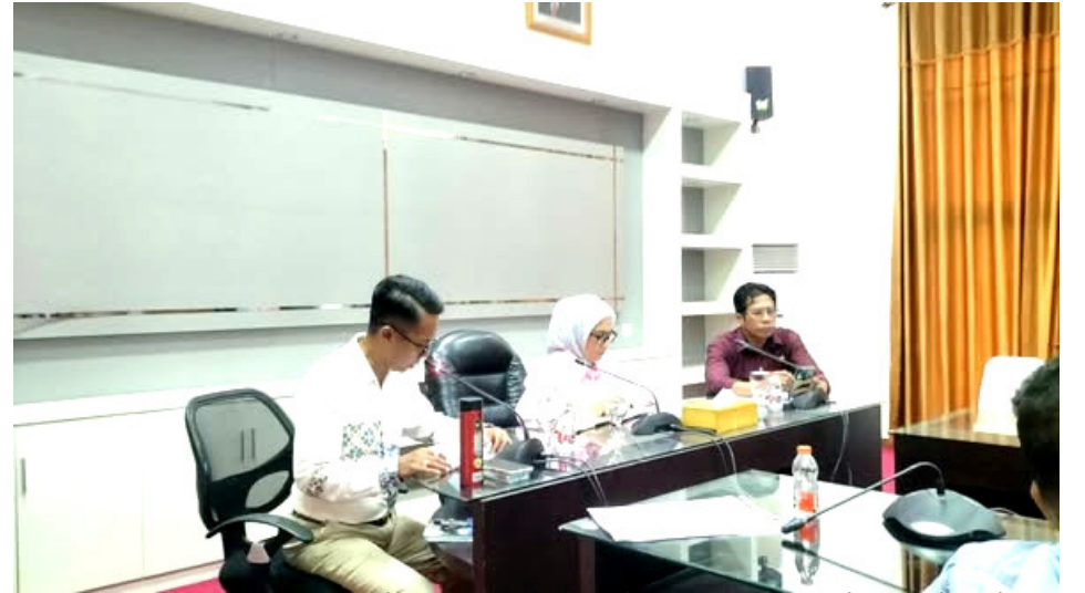
Pemerintah Kota Baubau memastikan kesiapan mengikuti seluruh rangkaian kegiatan Harmoni Sultra 2026