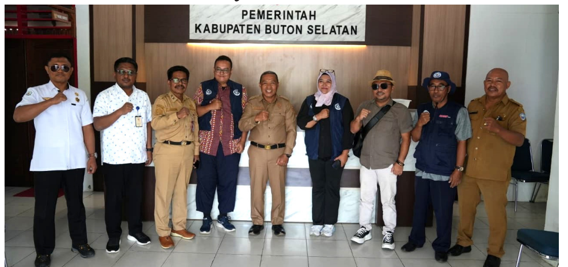
Pemerintah pusat melalui Kementerian Kelautan dan Perikanan (KKP) mulai mengkaji sejumlah wilayah pesisir di Kabupaten Buton Selatan, Sulawesi Tenggara, sebagai kandidat pembangunan Kampung Nelayan Merah Putih