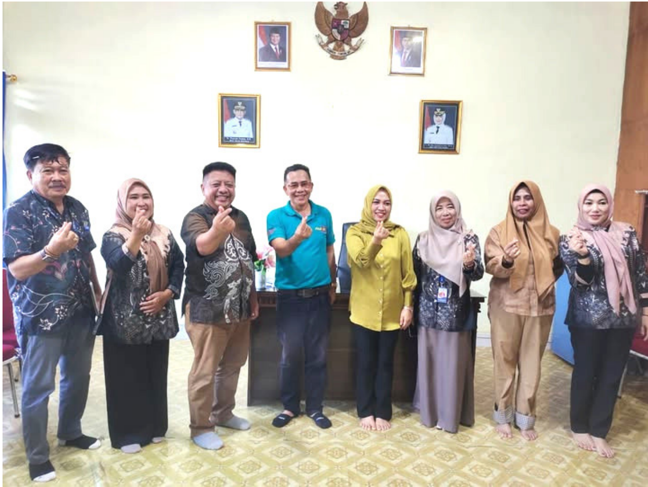
Pemerintah Kabupaten Kolaka Timur melakukan kunjungan kerja ke Kota Baubau untuk mempelajari strategi mempertahankan predikat Kota Layak Anak (KLA)