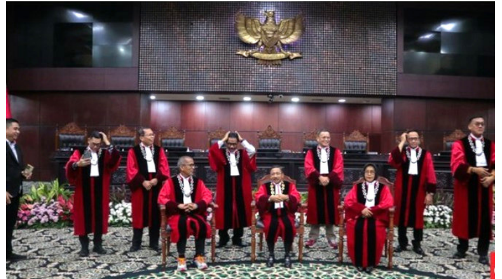
Hakim MK cecar operator seluler soal kuota internet hangus

JAKARTA -Persoalan kuota internet yang hangus kembali menjadi sorotan setelah Mahkamah Konstitusi (MK) mendalami praktik tersebut dalam sidang pengujian Undang-Undang Cipta Kerja. Delapan hakim konstitusi secara bergantian mengajukan pertanyaan kritis kepada operator seluler terkait dampak kebijakan itu terhadap masyarakat sebagai konsumen.