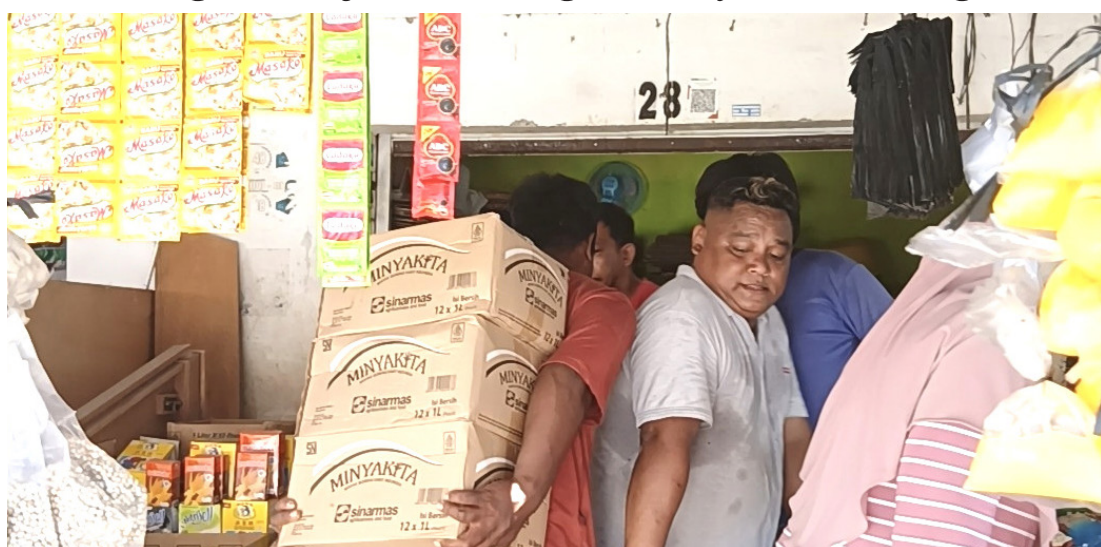
Perum Bulog Cabang Baubau bersama Dinas Perindustrian dan Perdagangan (Disperindag) Kota Baubau menyalurkan 8.900 liter minyak goreng merek Minyak Kita