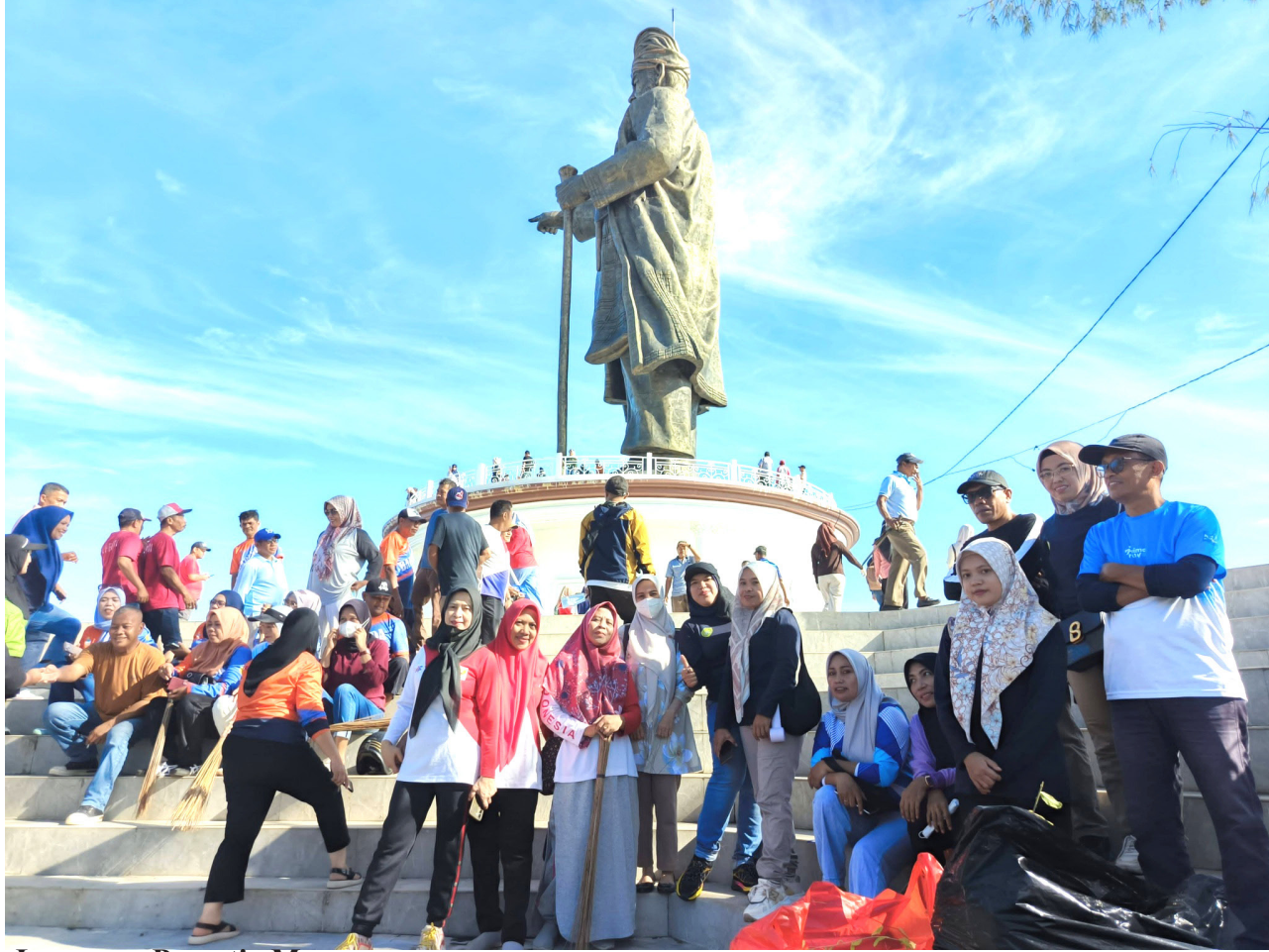
Laporan: Prasetyo M

BAUBAU, BP-Pemerintah Kota Baubau memastikan gerakan kebersihan lingkungan akan terus berlanjut secara berkelanjutan di seluruh wilayah kota melalui program "Indonesia Asri" yang digalakkan secara nasional. Komitmen tersebut ditegaskan melalui aksi bersih-bersih massal yang digelar di kawasan Kotamara, Sabtu (4/4/2026).