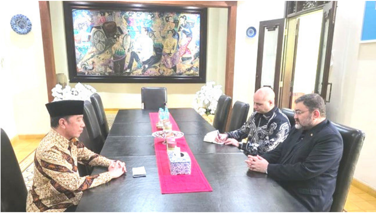
Presiden Jokowi menghormati keteguhan Iran dalam mempertahankan kedaulatan saat bertemu Dubes Iran