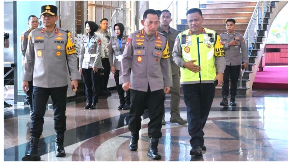
Ilustrasi. DPR apresiasi soalnya pengamanan lalu lintas oleh Polri soal arus mudik lebaran 2026.