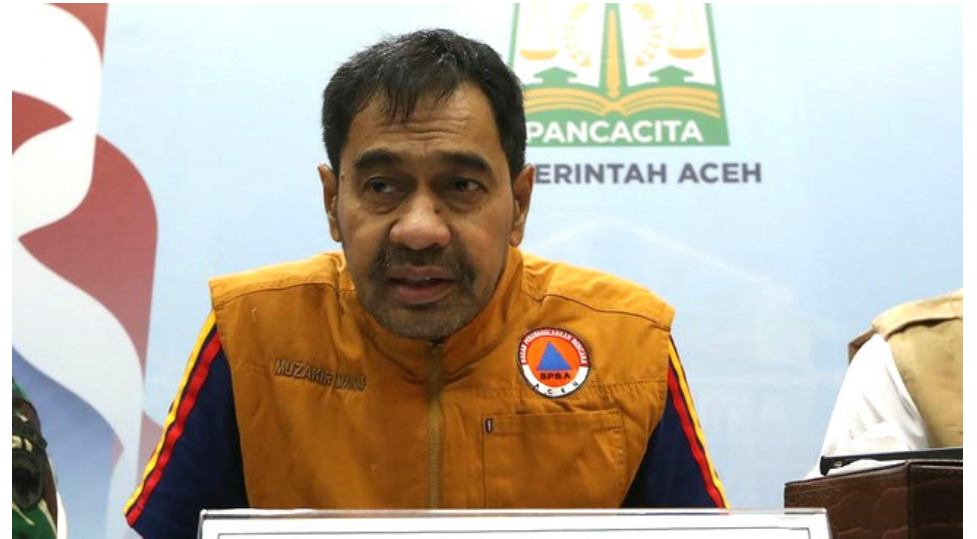
Gubernur Aceh Mualem Tekankan Kenaikan Dana Otsus 2,5 Persen untuk Pemulihan Daerah, DPR Janjikan Penyelesaian Tahun Ini