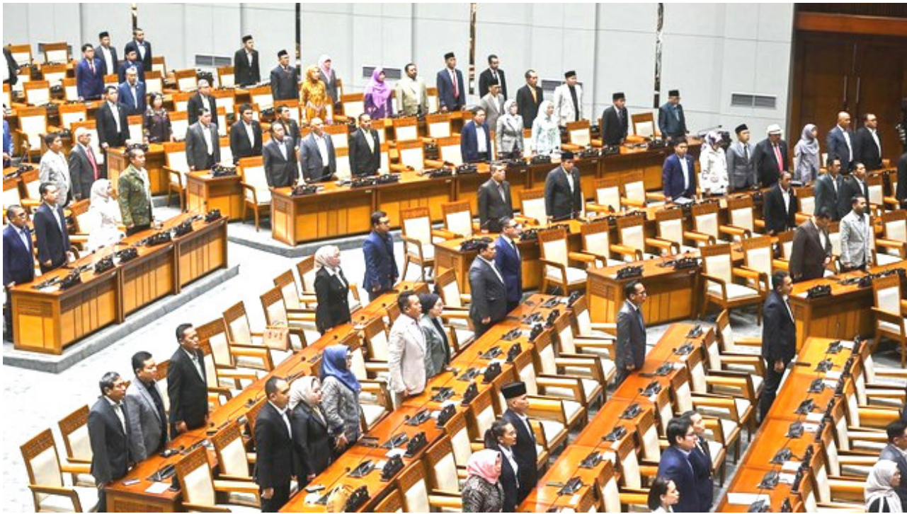
Baleg DPR Sepakati 5 RUU Baru dan Evaluasi Prolegnas 2026