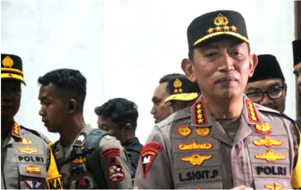
Kapolri Listyo Sigit Prabowo