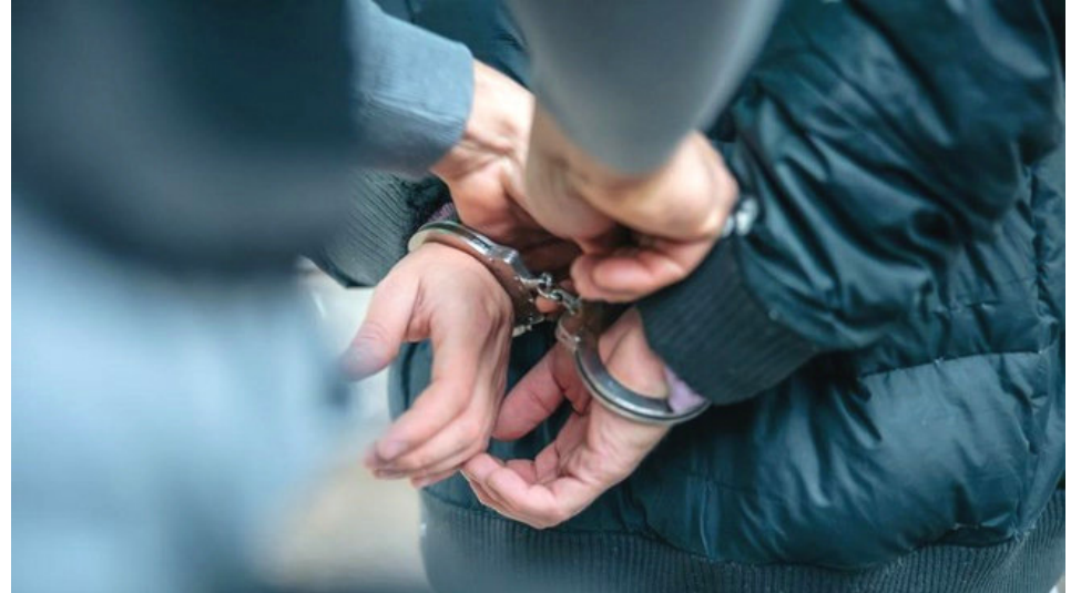
Kejaksanaan Tinggi Jawa Timur menetapkan dan menahan tiga pejabat Dinas Energi dan Sumber Daya Mineral (ESDM) Provinsi Jawa Timur