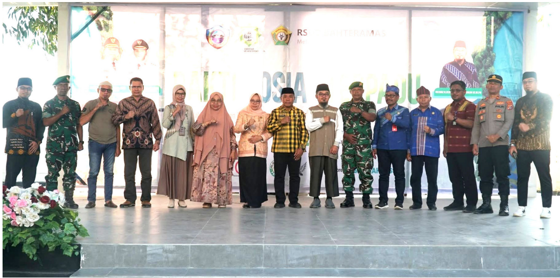
Pemerintah Kabupaten Buton Selatan (Busel) bersama Yayasan Sahabat Muadz Indonesia (SMI) menggelar bakti sosial terpadu

Laporan: Firman, Baubau Post-Durasi Times