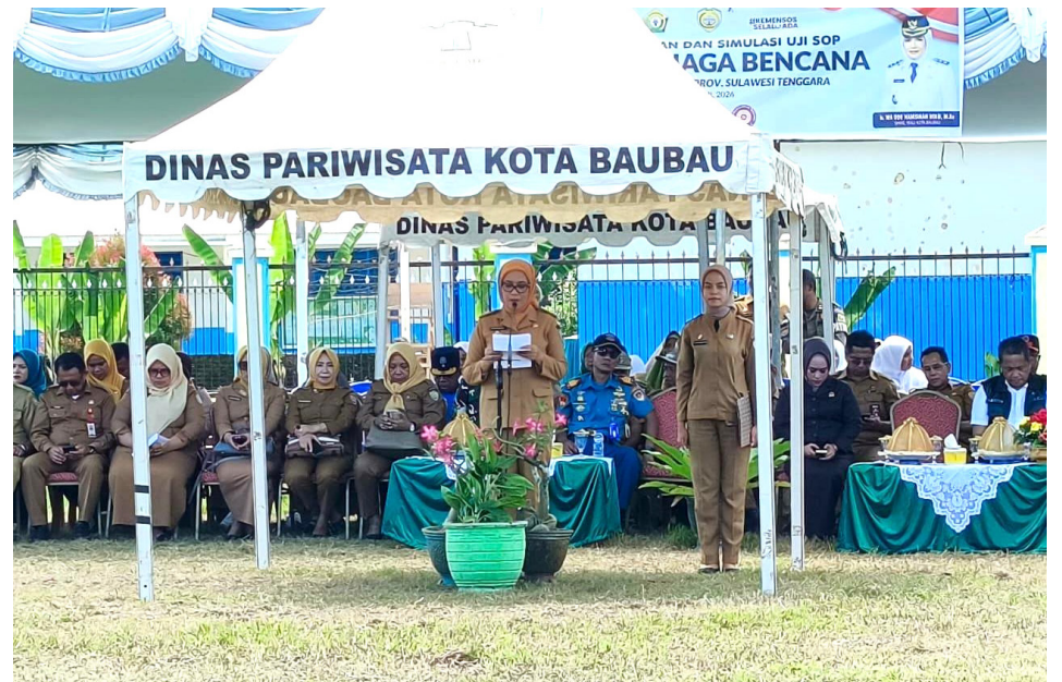
Pemerintah Kota Baubau terus memperkuat kapasitas mitigasi bencana melalui penguatan Kampung Siaga Bencana (KSB) di Kelurahan Lowu-Lowu, Senin (13/04/2026).