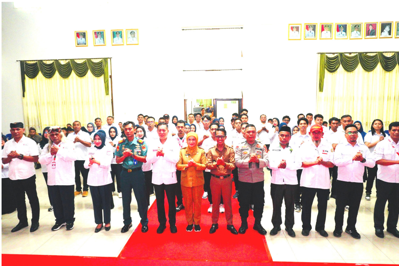
Kebutuhan darah yang tinggi di Kota Baubau menjadi salah satu fokus utama Palang Merah Indonesia (PMI) setempat setelah pengurus struktural Markas PMI Kota Baubau masa bakti 2025-2030