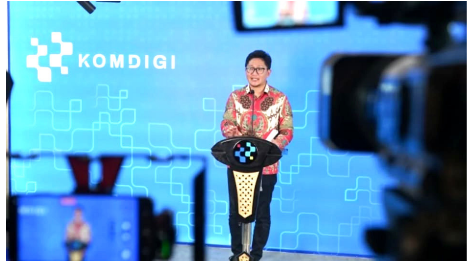
Pemerintah melalui Kementerian Komunikasi dan Digital (Kemkomdigi) memastikan penguatan perlindungan konsumen digital