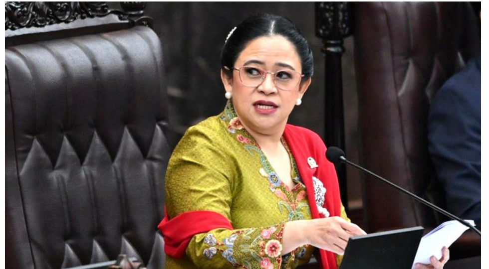
Ketua DPR Puan Maharani menegaskan UU TPKS memberikan hukuman berat bagi pelaku kekerasan seksual, mendorong penegakan hukum dan perlindungan korban.