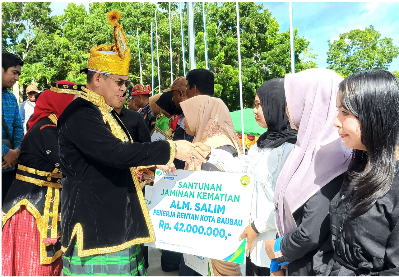
Pemerintah Kota Baubau menegaskan komitmennya dalam memperkuat pembangunan sumber daya manusia dan otonomi daerah melalui upacara peringatan Hari Pendidikan Nasional (Hardiknas) dan Hari Otonomi Daerah (Otoda) ke-30 tahun 2026