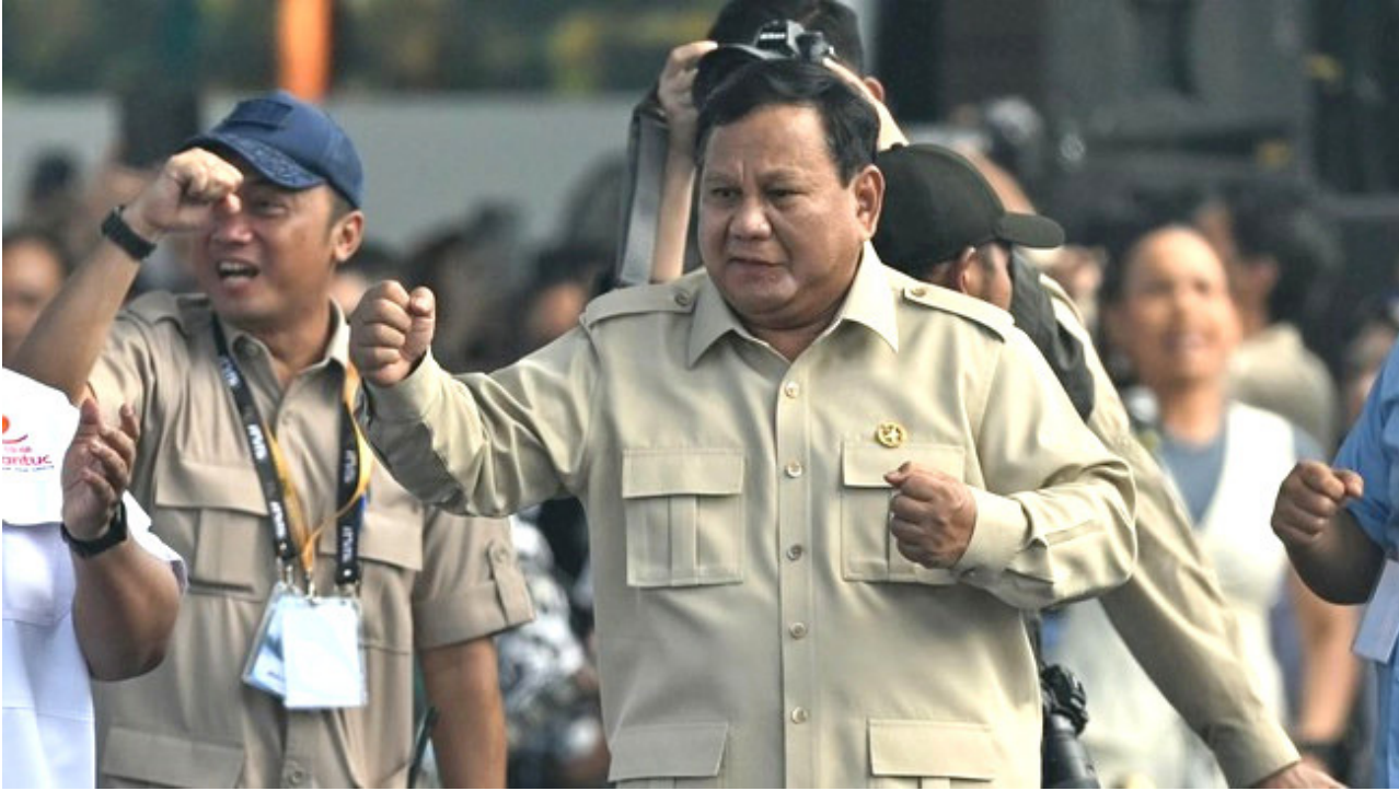
Presiden Prabowo Subianto menerbitkan Peraturan Presiden (Perpres) Nomor 15 Tahun 2026 tentang Rencana Aksi Nasional Pencegahan dan Penanggulangan Ekstremisme Berbasis Kekerasan yang Mengarah pada Terorisme (RAN PE) Tahun 2026-2029.