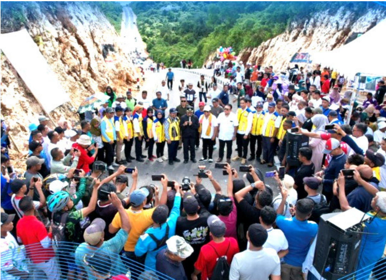
Pemerintah Kabupaten Buton Tengah meluncurkan program Labungkari Samentaeno di ruas Jalan Poros RSUD Buton Tengah, Sabtu (16/5/2026)