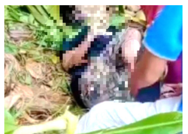
Pria 57 Tahun di Buton menebang pohon pisang di kebun milik sendiri berakhir tragis

Korban diduga tidak sempat menyelamatkan diri ketika tiga pohon pisang di sekitar lokasi ikut roboh secara bersa-