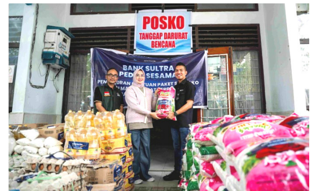
Bank Sultra kembali menunjukkan perannya sebagai institusi perbankan daerah yang aktif dalam kegiatan sosial