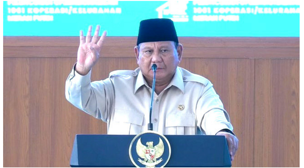
Prabowo gebrak podium saat resmikan koperasi merah putih