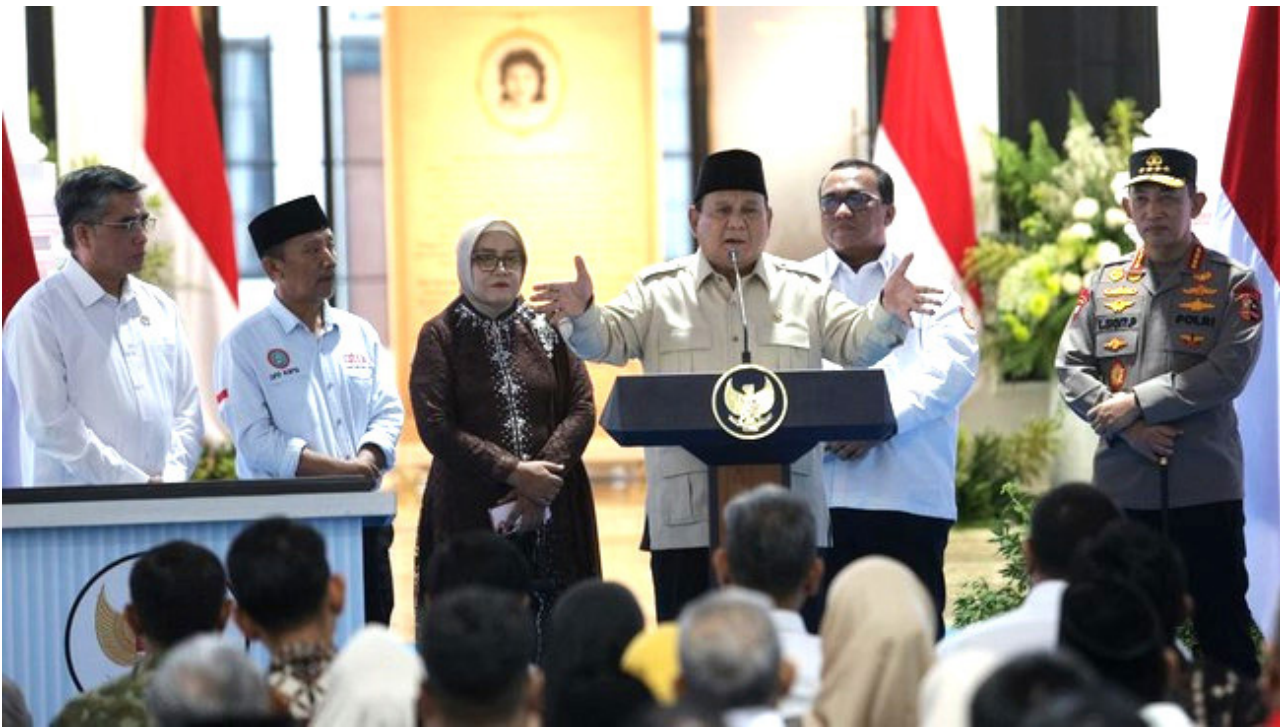
Prabowo klaim negara lain minta korting beli beras Indonesia.