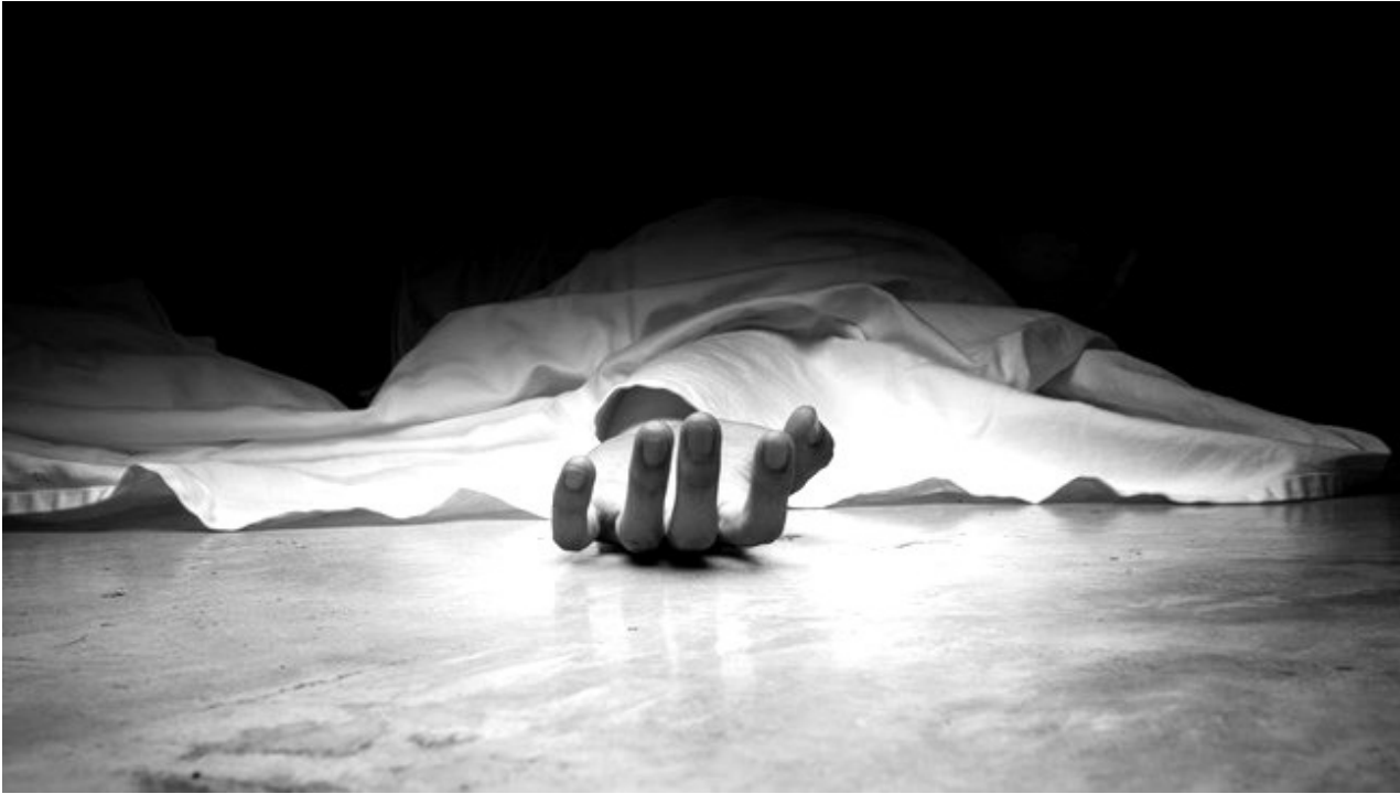
Ilustrasi: Imigrasi Surabaya Selidiki Kematian WNA India Kasus Overstay 248 Hari