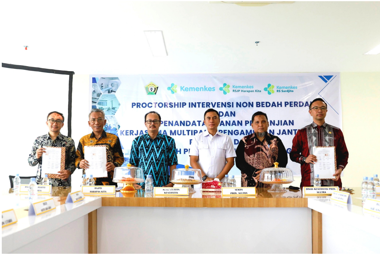
Pemerintah Provinsi Sulawesi Tenggara mulai memperkuat layanan kesehatan spesialistik dengan menghadirkan tindakan Intervensi Non Bedah (INB) jantung di RSJPD Oputa Yi Koo Kendari, Jumat (15/5/2026)