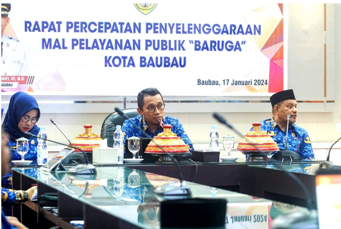
Pewarta : Amat Jr

BAUBAU, BP-Tidak lama lagi Kota Baubau akan memiliki Mal Pelayanan Publik (MPP) yang merupakan layanan terintegrasi satu pintu dengan berbagai layanan dari instansi pemerintah, BUMN maupun pihak swasta untuk memudahkan masyarakat mendapatkan pelayanan.