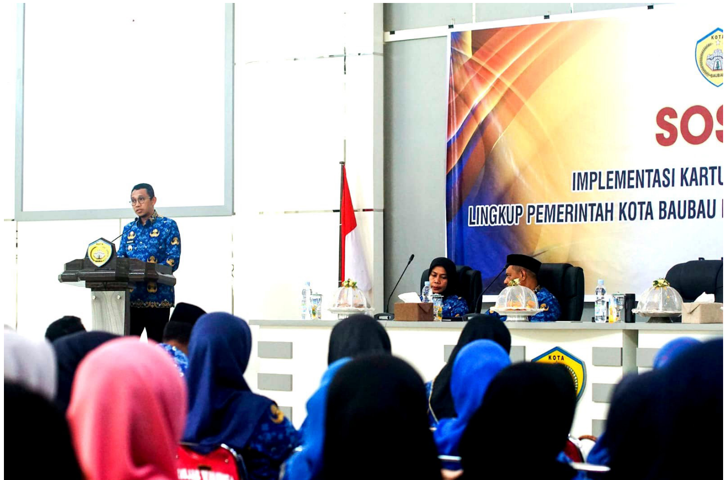
Pewarta : Amat Jr

BAUBAU, BP-Dukung Digitalisasi Sistem Pembayaran Pemkot Baubau mendorong penggunaan Kartu Kredit Pemerintah Daerah (KKPD) guna mendukung secara makro digitalisasi sistem pembayaran.