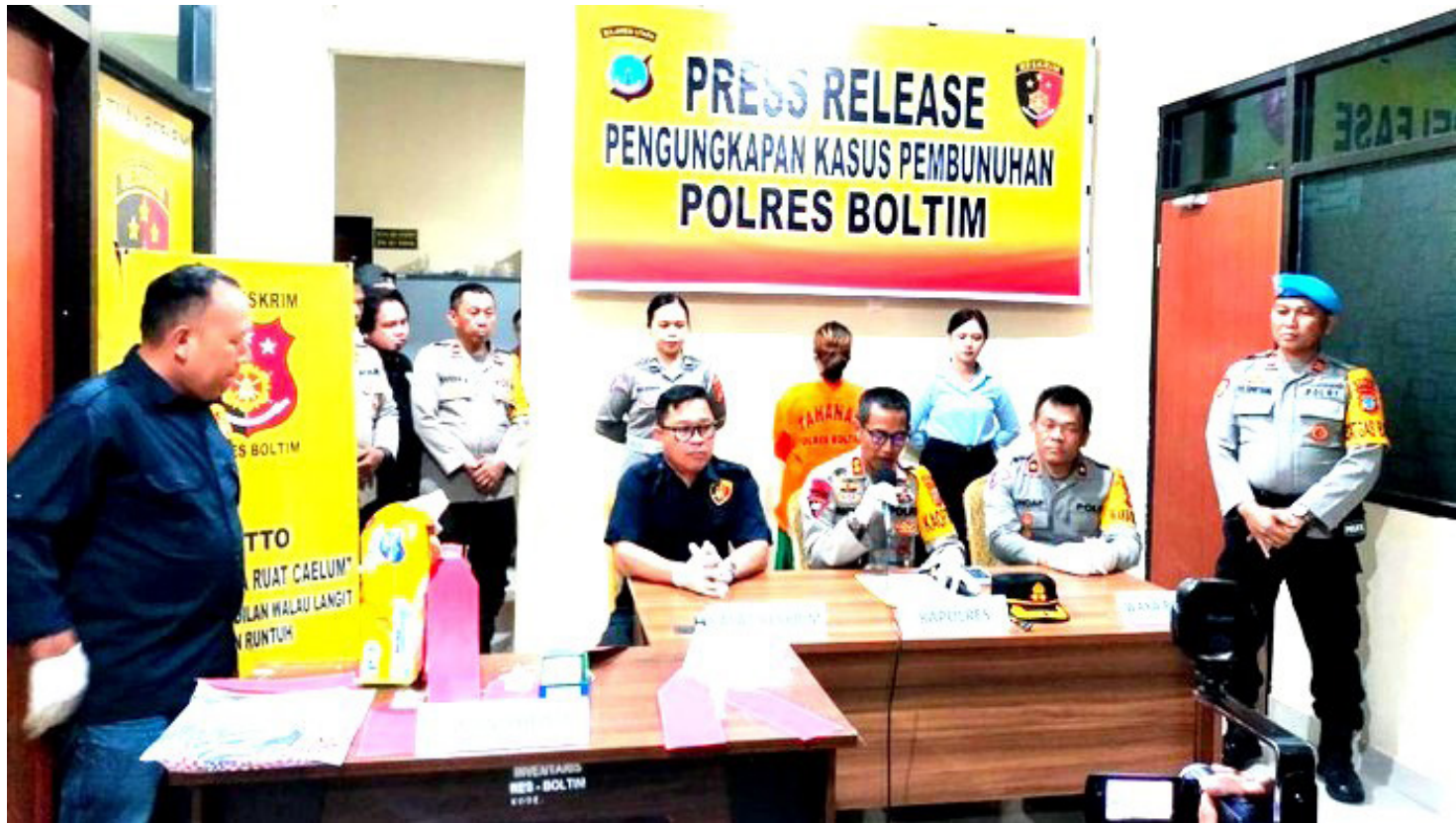
Polres Boltom, Sulut gelar Konferensi Pers Pembunuhan Bocah 8 tahun